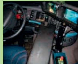
Commande embarquée du « bras » de levée des bacs dans la cabine du véhicule, avec caméras de surveillance.